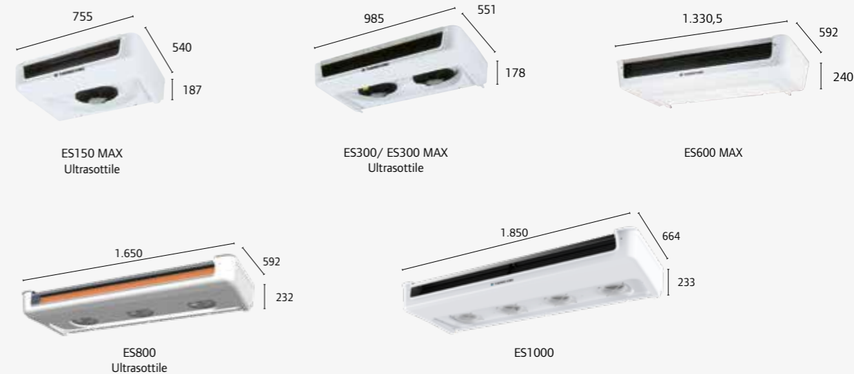
ES150 MAX Ultrasottile