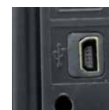
USB-Anschluss – Detail