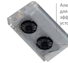
Алюминиевый испаритель для повышения эффективности и устойчивости к коррозии